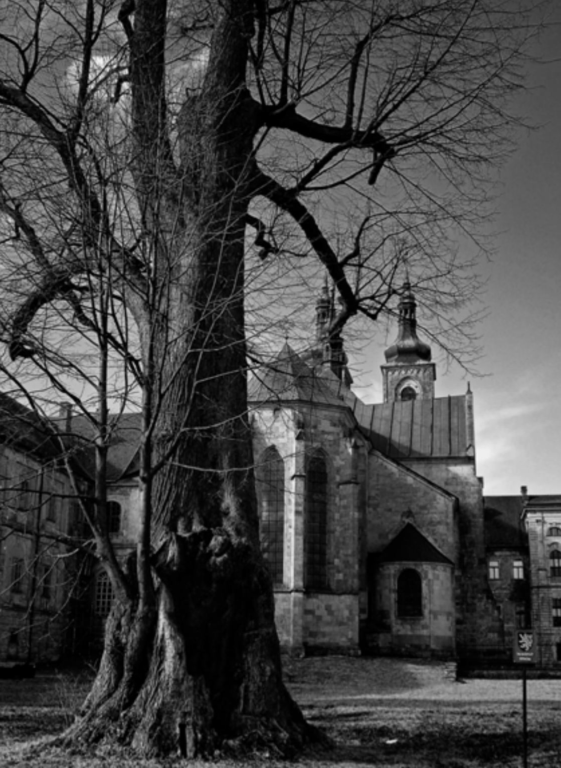
PS Hroznatova lípa.