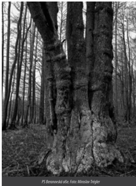
PS Beranovská oře.