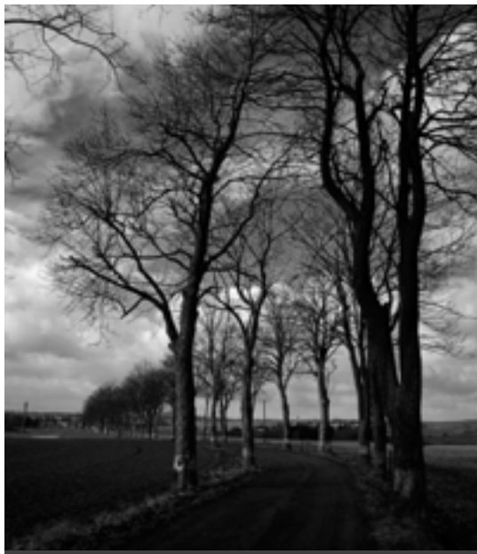
VKP Tepelská stromořadí – k Dřevohryzům.

konventu. Zásahy do silničních stromořadí doposud zajišťují správci komunikací (v tomto případě Údržba silnic Karlovarského kraje, a. s.) vlastními silami. Jelikož nejde o firmu specializovanou na údržbu zeleně (řezy stromů), je kvalita provedení zásahů někdy neuspokojivá. V současné době, a díky oboustrannému pochopení a dialogu mezi ochranou přírody a správci a vlastníky komunikací, začínáme realizovat myšlenku odborného ošetření vybraných stromořadí arboristickými firmami. Podmínkou je zajistit dostatečné finanční prostředky. Ve věci získání dotací nám aktivně pomáhá karlovarské pracoviště Agentury ochrany přírody a krajiny ČR a tak věřím, že v příštím roce bude již realizován první projekt odborného ošetření vybraných stromořadí na Tepelsku. Myslím, že se daří i přibližovat názory na možnosti a cesty k uchování kontinuity silničních stromořadí. Bylo by nesprávné zničit několika neuváženými kroky fenomén, který nám v kulturní krajině zanechal naši předci.