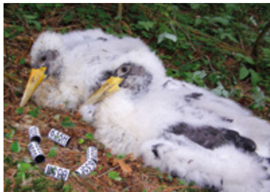
Čápi černí čekající ve frontě na kroužek.

A tak se díky kroužkování letos poprvé i čápa ta ze Slavkovského lesa stala součástí celorepublikového projektu sledování osudů čápů černých i jejich tahových cest. Díky kroužkování se můžeme dozvědět mnoho zajímavostí ze života našich čápů černých, například věrnost partnerů, věrnost hnízdišti i délku života. Čápi černí létají zimovat až do rovníkové a jižní Afriky, přičemž musí urazit kolem 10 000 km. Popřejme tedy letošním osmi mláďatům mnoho štěstí a doufejme, že se s nimi ještě setkáme.