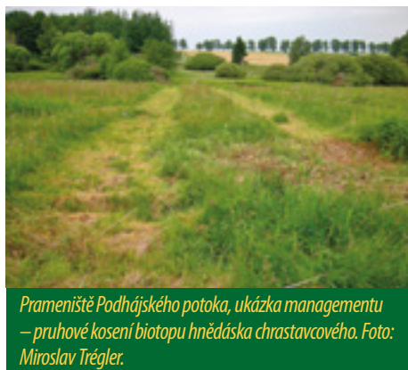
Prameniště Podhájského potoka, ukázka managementu – pruhové kosení biotopu hnědáška chrastavcového.

Od roku 2008 zajišťuje MěÚ Mariánské Lázně údržbu plochy v rozsahu kosení mokřích luk a pomístní redukce náletových dřevin. Kosení ploch s výskytem hnědáška chrastavcového se provádí v první půli června v pruzích s ohledem na vývoj vzácného motýla. Management je financován z Programu péče o krajinu a z rozpočtu města Mariánské Lázně.