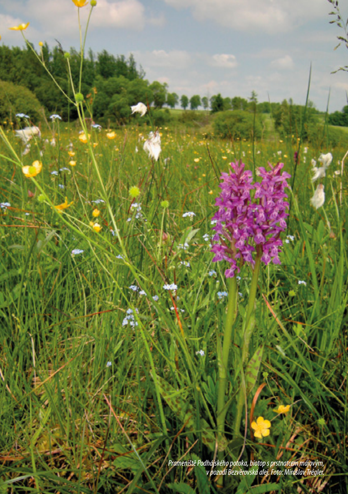
Prameniště Podhájského potoka, biotop s prstnatcem májovým, v pozadí Bezvěrovská alej.