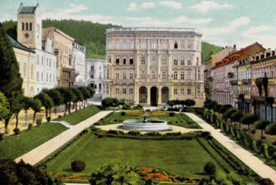
Dobová pohlednice Mírového náměstí s realizovanými úpravami.