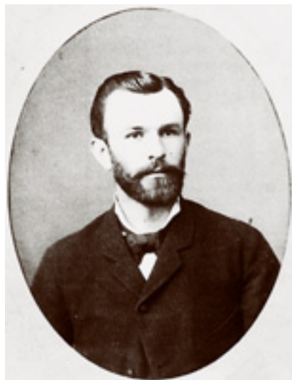
František Josef Thomayer.

Zahradní a parková spol. s r.o., Mariánské Lázně