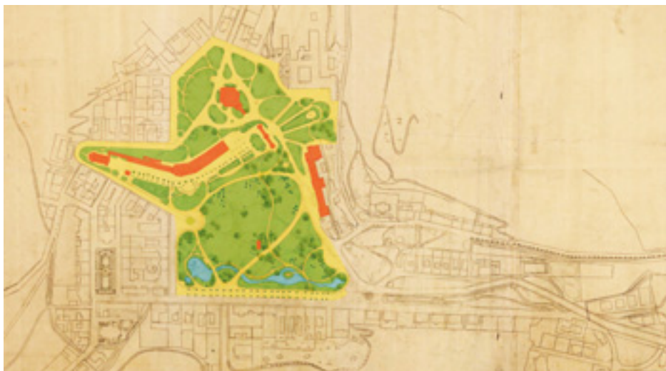
Thomayerův plán centrálního parku z roku 1893.

Na kopii plánu z roku 1893 jsou pro větší názornost zvýrazněny cesty a trávnickové plochy (zvýrazněno