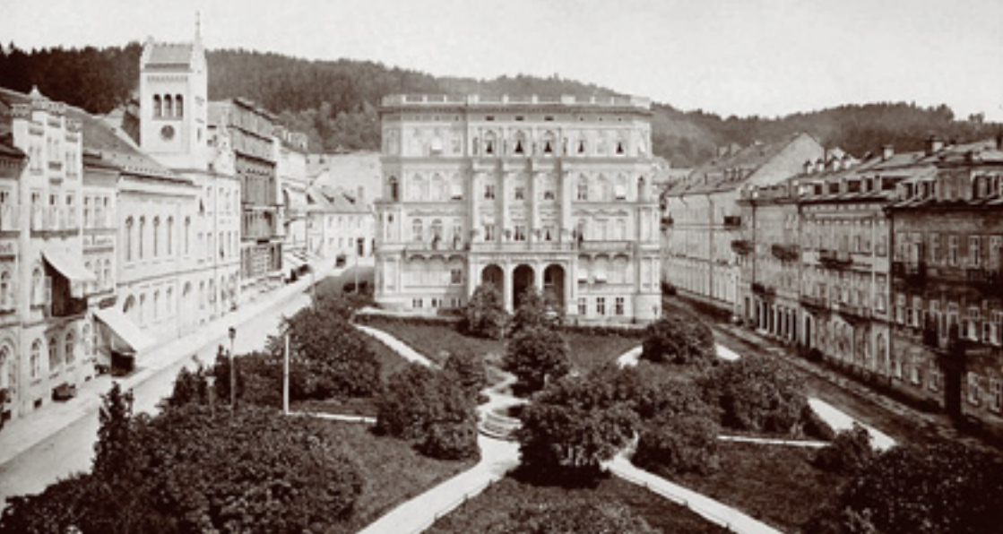
Mírové náměstí před Thomayerovou úpravou. Sbíрка Městské muzeum Mariánské Lázně.