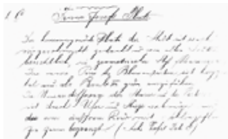
Rukopis Thomayera s popisem úprav Mírového náměstí.