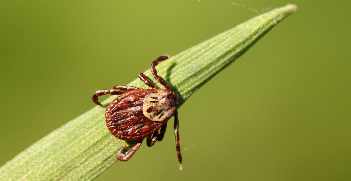
Obr. 1: Samička pijáka lužního ( Dermacentor reticulatus ).