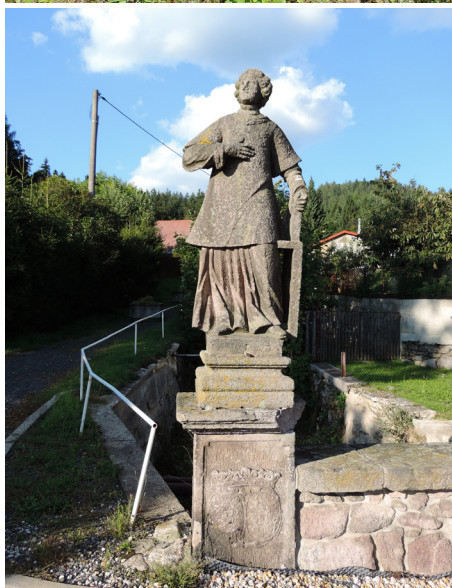
▲ Nadzemní hydrant u domu č. p. 3.