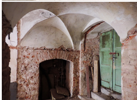
▲ Gotické sanktuárium ve věži kostela svaté Markéty v Kynžvartě.