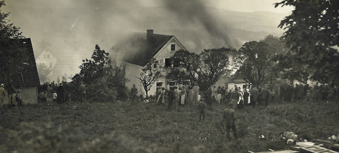
Fotografie požáru obytné budovy ve městě Lázně Kynžvart, pravděpodobně z první poloviny 20. století.