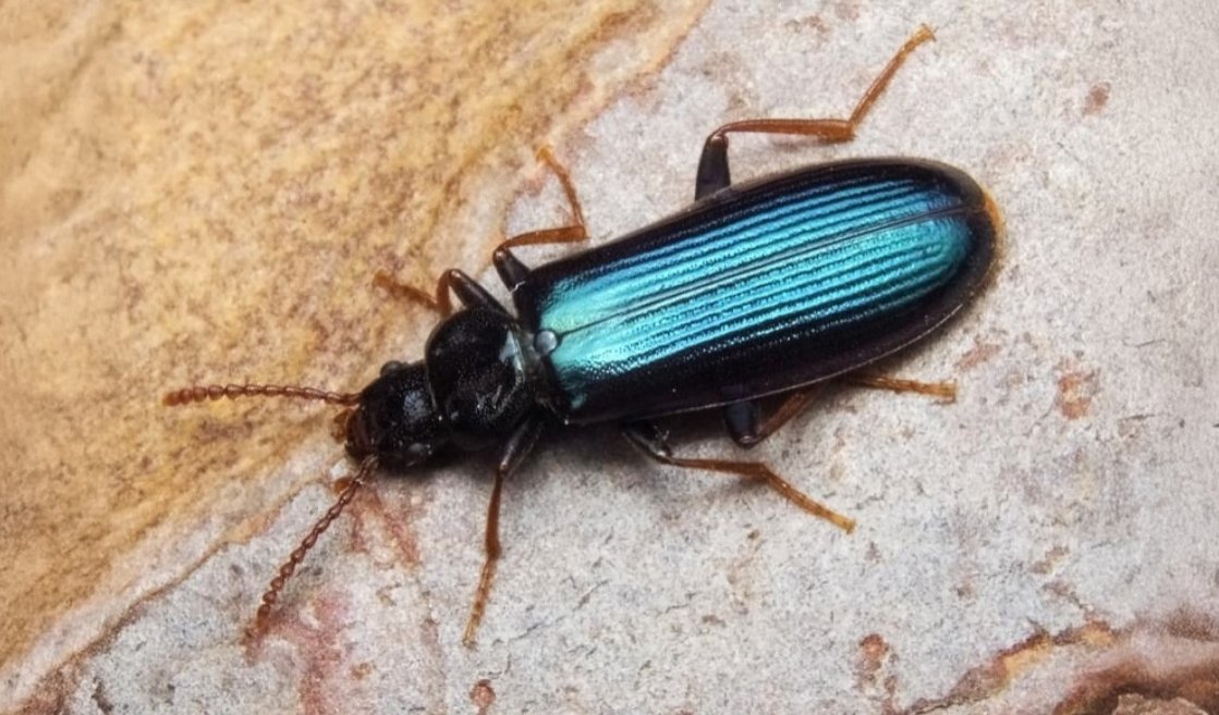
Pytho depressus .