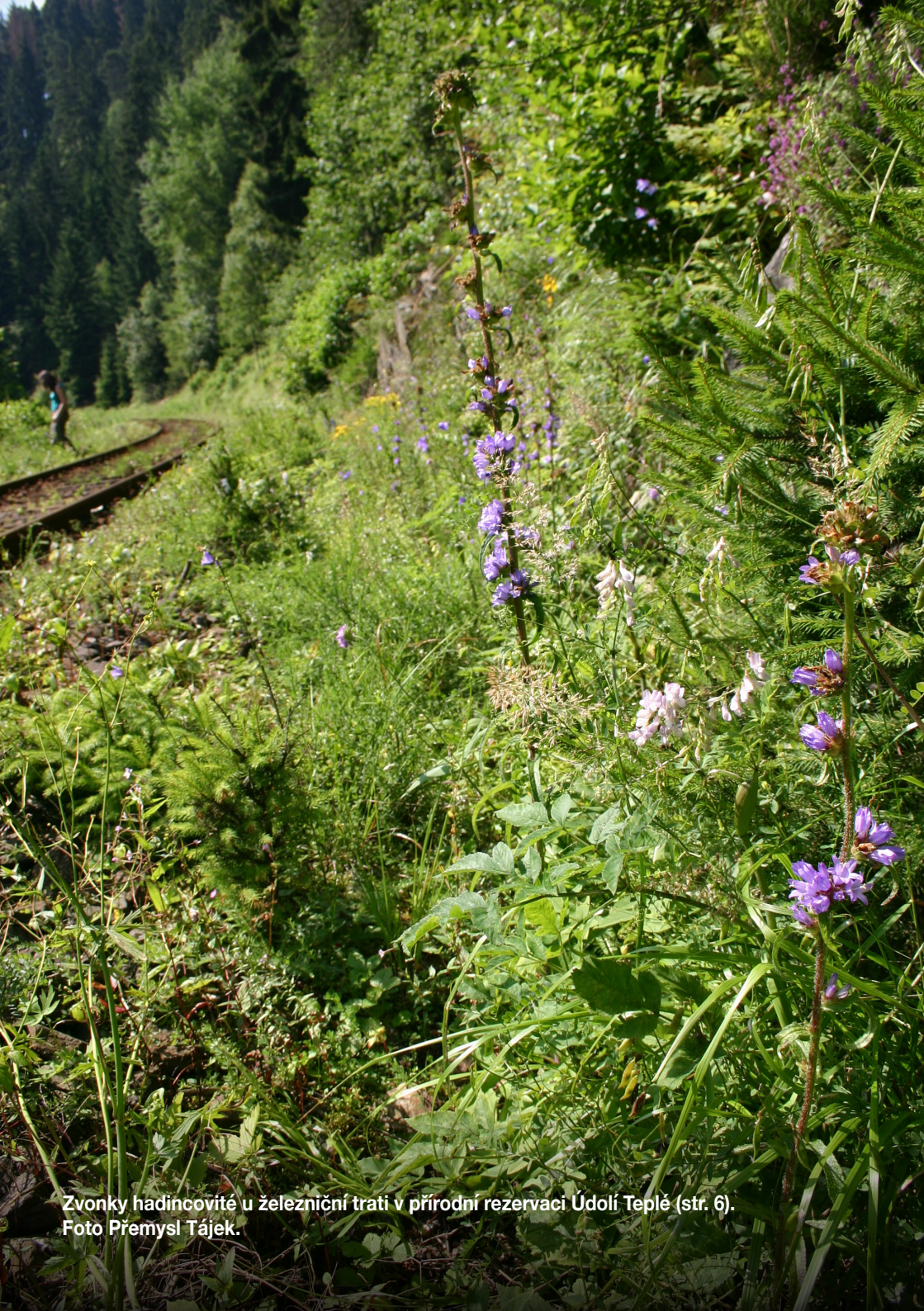
Zvonky hadincovité u železniční trati v přírodní rezervaci Údolí Teplé (str. 6).